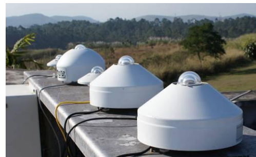
Fig. 3. Sistema de calibração outdoor do CPTEC/LIM

Os piranômetros de teste e padrão foram montados lado a lado na mesa de calibração situada na cobertura do prédio do CPTEC/LIM (latitude: 22° 39' 49" S, longitude: 45° 00' 34" O, altitude: 563 m), conforme Figura 3.