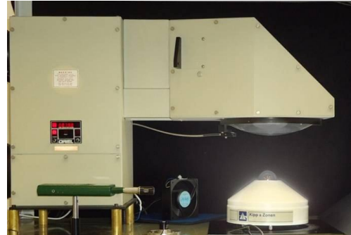
Fig. 2. Sistema de calibração indoor realizado no LAS

da lâmpada. Para cada valor de irradiância ajustado no simulador foram realizadas 30 leituras consecutivas no padrão de trabalho e depois mais 30 leituras consecutivas no piranômetro sob teste, considerando um intervalo de 1 minuto entre cada leitura. Os valores foram armazenados no datalogger e posteriormente foram feitos os cálculos.